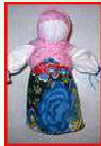
КУКЛА - ЗАКРУТКА